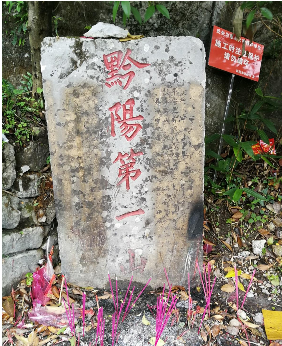
《黔阳第一山》碑

这次田野考察活动为时一天，时间虽然短促，但是师生们熟悉和了解了拓碑的方法和技术并进行了实际操作，还通过田野访谈和参与观察的人类学方法，了解香炉山的历史文化事迹。重要的是通过田野实践活动，让2016级和2017级的学员们知道田野考察的基本原则，熟悉了田野考察的要点，为以后进一步进行田野调查等实践教学活动奠定了基础。