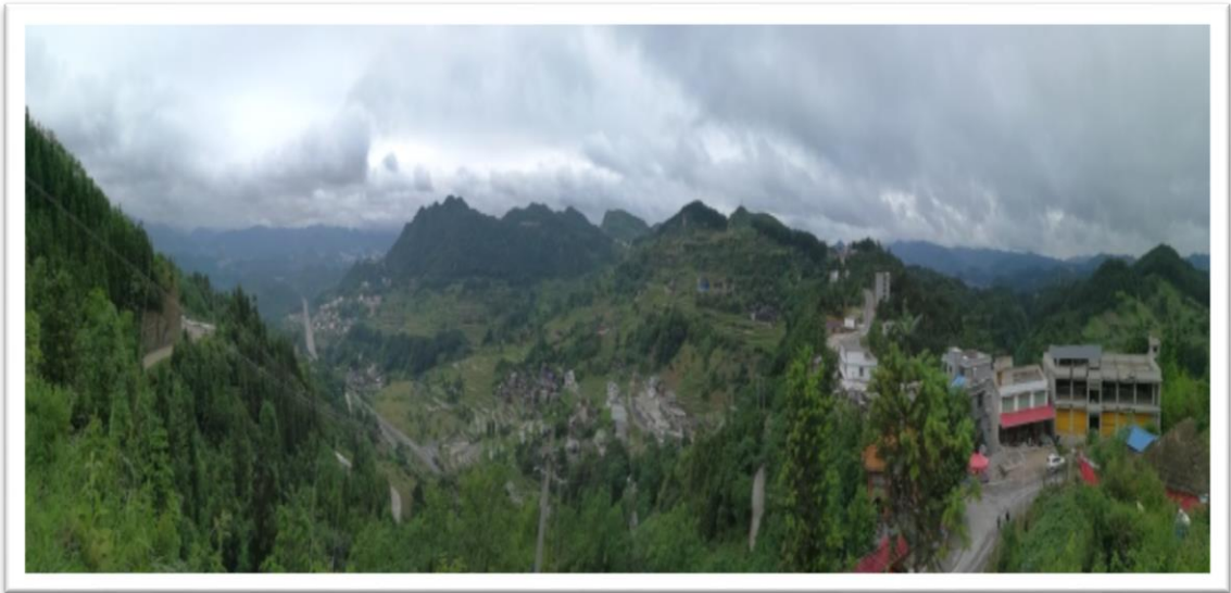
香炉山风景

5月27日上午7点整，各个成员准时从凯里学院校门口出发前往凯里市香炉山。考察地点在香炉山半山腰，当日气温较低，不少学员不禁寒颤。