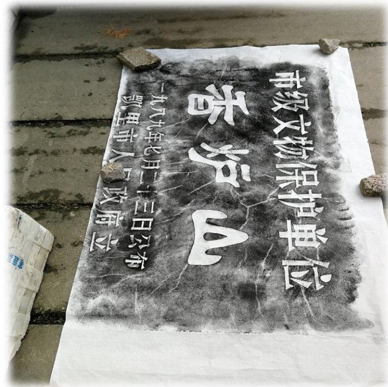
香炉山公示碑拓片

在等待碑刻晾干的时候，我们分出一部分同学去寻找顾氏后人，询问香炉山顾氏相关的事迹。在半山腰的一家小卖部里面，访问了顾氏后人顾永利。顾永利是顾成的十九代子孙，家族的传承和祖先的记忆大多已经比较模糊，但是在交谈中多次强调了本支祖先顾良相镇守香炉山的事情，认为自己的家族是朝廷帝王派来“镇压反皇”的，甚至对一些有关顾氏先祖军事行动的细节都讲述得很清楚。通过强调祖先对当地治理的合法性和权威性来显示顾氏家族在地方社会权力结构上的地位，大概是顾氏后人不断重构“祖先记忆”行为的动机。